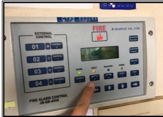
ตรวจสอบ Fire Alarm

การปฐมพยาบาล ผู้ได้รับสารเคมี กรณีฉุกเฉิน เรามิมีความจำเป็น หากเรืออยู่ในทะเลเปิดและ จะต้องใช้เวลาในการเดินทาง เพื่อเป็นการรักษา และหยุดยั้งความเสียหายหรือความเสี่ยงแก่บุคคล บนเรืออาจจะต้องมีความรู้และความสามารถในการจัดการหาก มีก๊อบบะเกิดขึ้นจริงบน เรือ โดยท่านจะต้องผ่านการอบรมหลักสูตร Medical Care on board ตามข้อกำหนดของ IMO