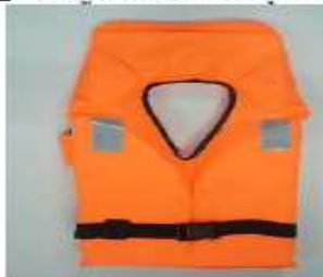
เสื้อชูชีพแบบคอหอย (York Type)