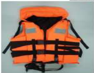
เสื้อชูชีพแบบเสื้อกั๊ก (Vest Type)

ภาพแสดง เสื้อชูชีพที่ได้รับการอนุมัติจากกรมเจ้าท่า